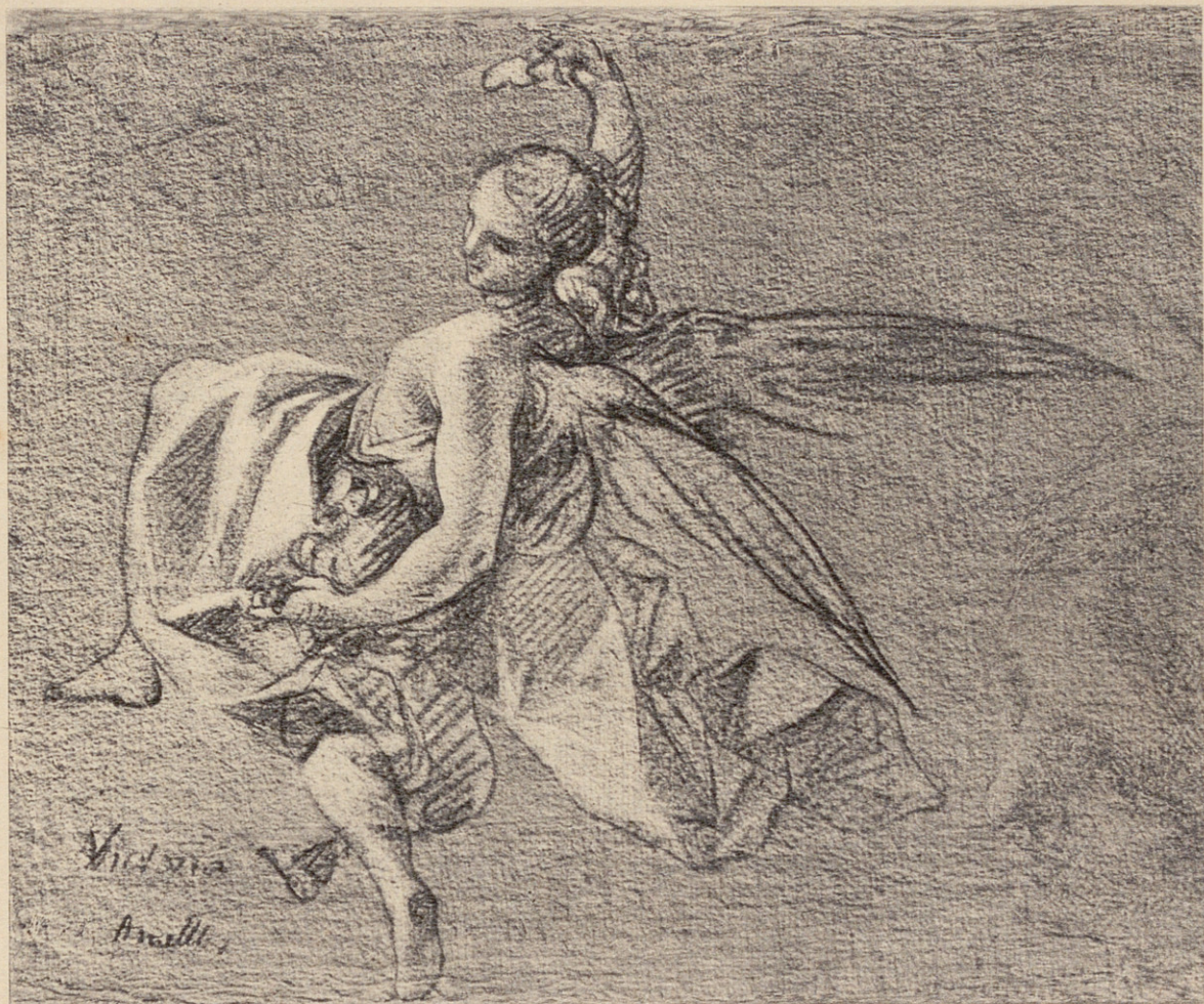
Dibuix de Blai Ametller (Barcelona, * 1768 - † 1841) Biblioteca dels Museus d'Art de Barcelona

ASSOCIACIÓ DE MÚSICA "DA CAMERA" DE BARCELONA